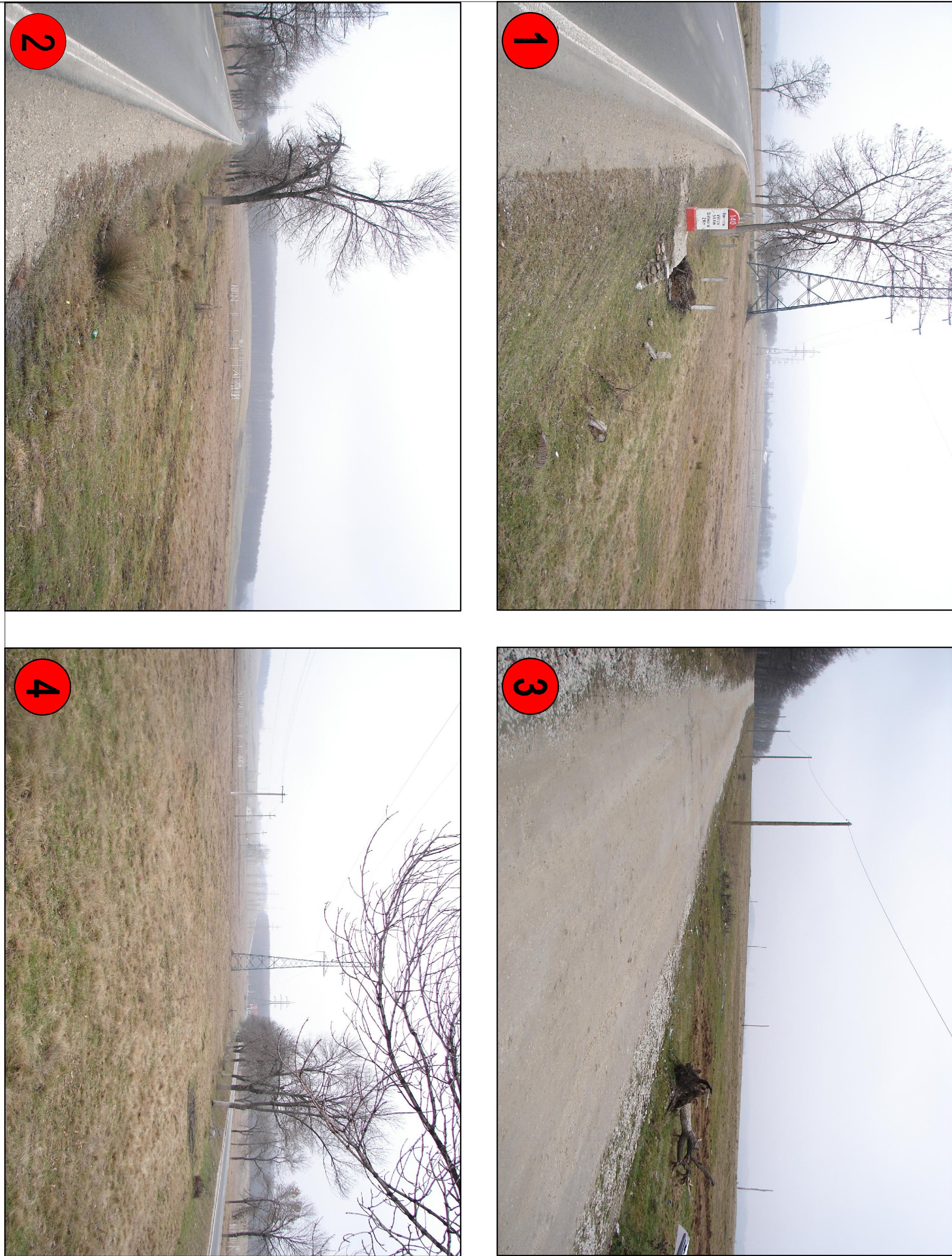
Imagini situatia existenta

Zona studiata = 271 120 mp (suprafata care a generat PUZ) Suprafata teren propusa spre introducere in intravilan = 250000mp (25 ha)