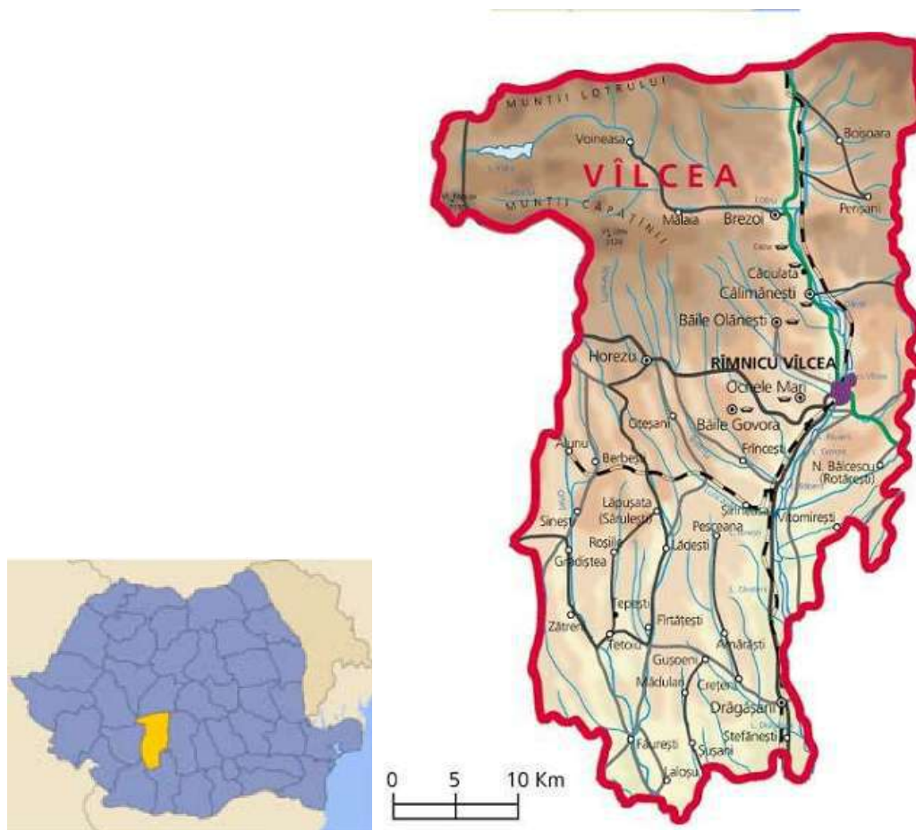
Amplasarea judetului Valcea

Judetul Valcea este format din 89 localitati din care: