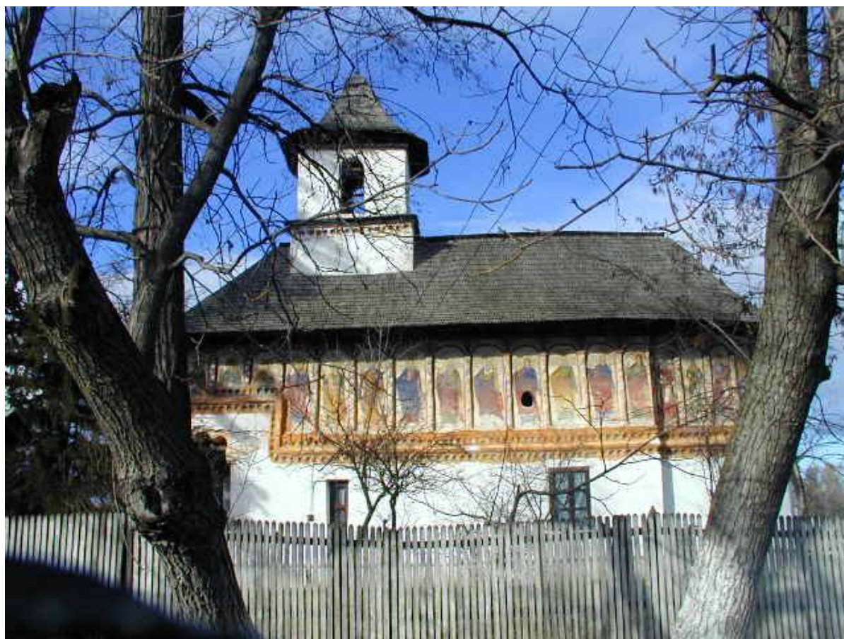
Biserica „Sf. Împărați” și „Sf. Matei”, 1840

Biserica de lemn “Adormirea Maicii Domnului” , monument istoric înscris în LMI cu codul VL-II-m-B-09838 este o biserică mică, din lemn, construită în anul 1768, în satul Obislavu, comuna Grădiștea. Această bisericuță a fost ridicată inițial la „Scoruș” și mutată în anul 1991 în acest loc împreună cu cimitirul. Aflându-se în incinta cimitirului, este sufocată de morminte aflate la o distanță care uneori nu depășește un metru. Intervențiile recente s-au rezumat la reparații locale la soclu, pereți și pridvor, iar învelitoarea inițială din șită a fost acoperită cu o învelitoare din tablă zincată aplicată peste șită.