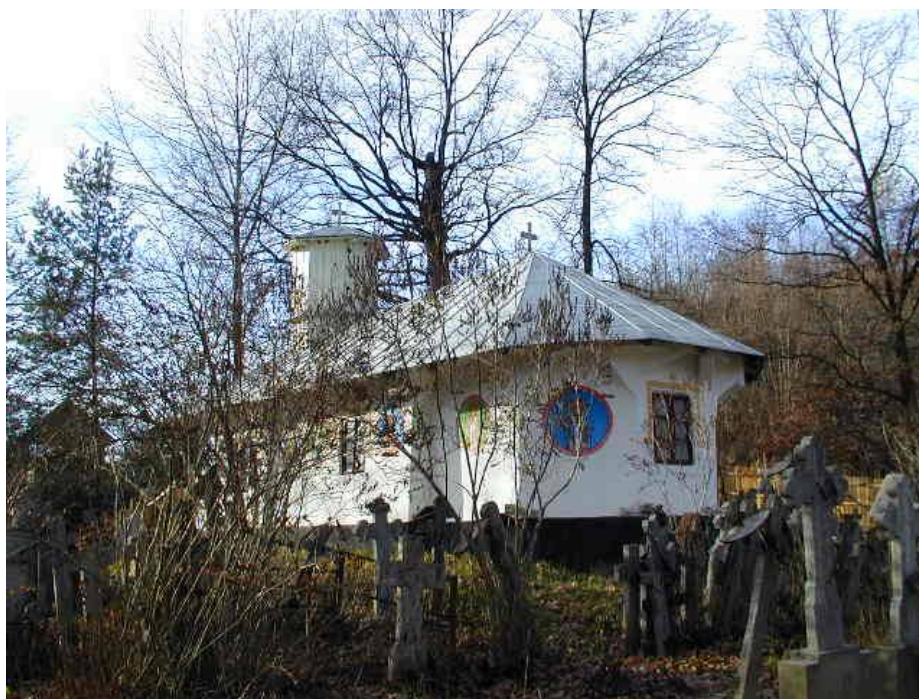
Biserica „Sf. Voievozi”, 1816