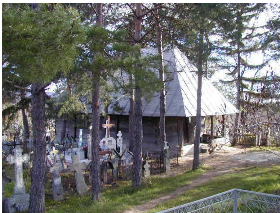
Biserica „Adormirea Maicii Domnului”, 1768