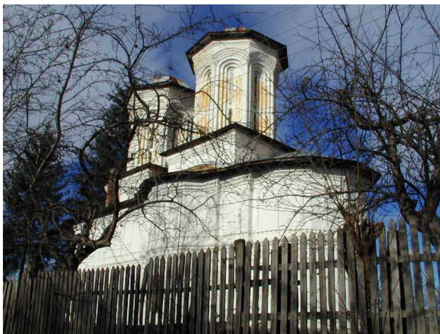
Biserica „Intrarea în Biserică”, (1722 – 1748, ref. 1775)