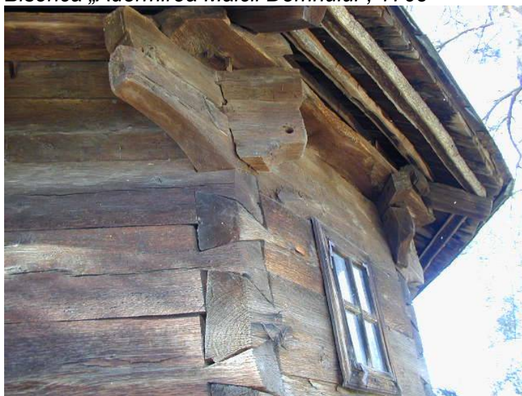
Detaliu îmbinare perete și streășină, Biserica „Adormirea Maicii Domnului”.